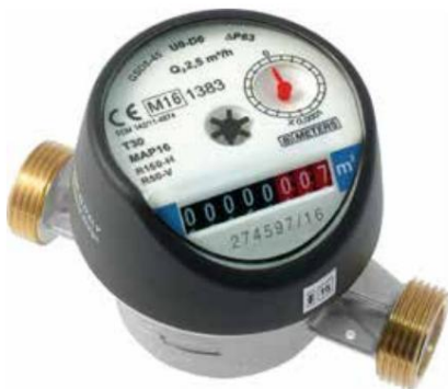
Külma vee arvesti HVAC 4418 010