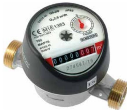
Sooja vee arvesti HVAC 4438 010